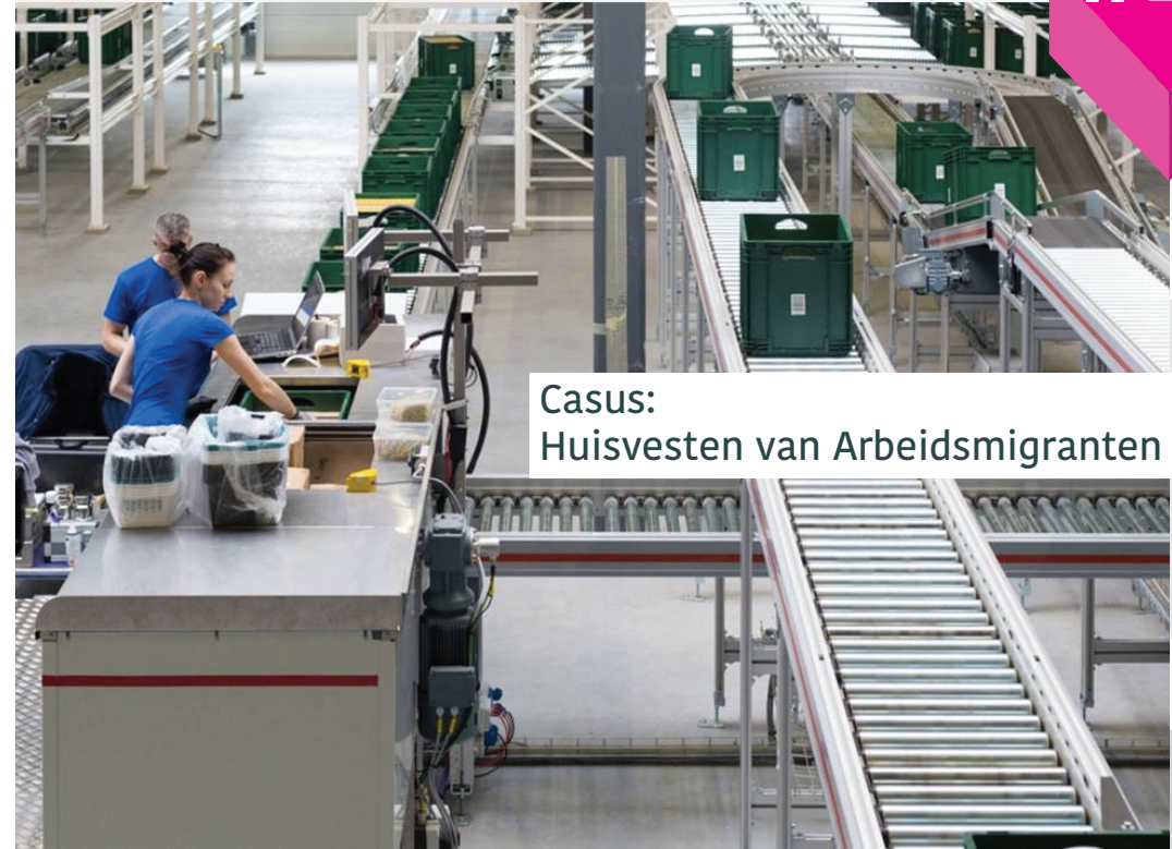
Casus: Huisvesten van Arbeidsmigranten

Het perspectief vanuit de overheid werd afgesloten door een deelnemer aan de Meet-up. Vanuit haar ervaring gaf zij aan dat het belangrijk is om als overheid, bijvoorbeeld het plaatsen van een AZC, niet direct als pijnlijk te labelen. Door dit te doen ga je daar ook naar handelen, wat de pijn weer groter maakt. Het komt er op neer dat je vooral moet blijven praten met elkaar, ook met de mensen uit het AZC, om te voorkomen dat je aannames werkelijkheid worden.